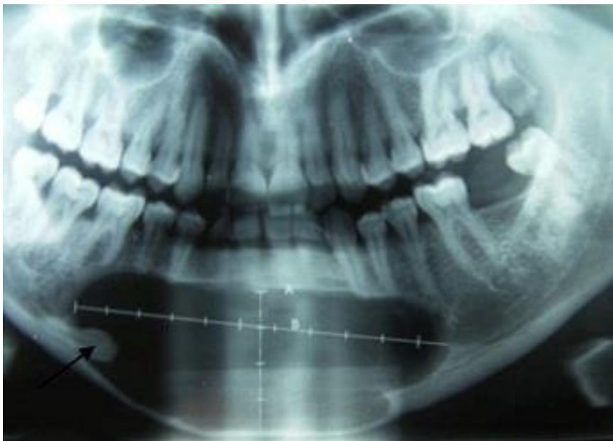
Figure 1: radiographie panoramique volumineuse lésion kystique ostéolytique, s'étendant de la 35 e à la 46 e avec amincissement de la corticale osseuse en regard et présence d'une canine incluse (flèche)