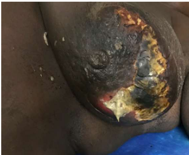
Figure 3: abcès du sein gauche fistulisé