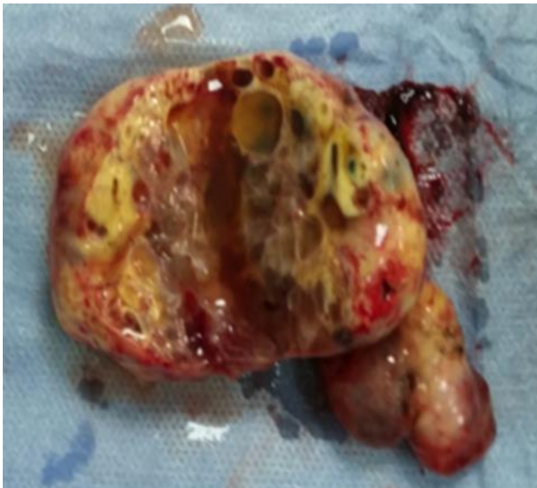
Figure 2: Pièce opératoire du kyste hémorragique de la vésicule séminale