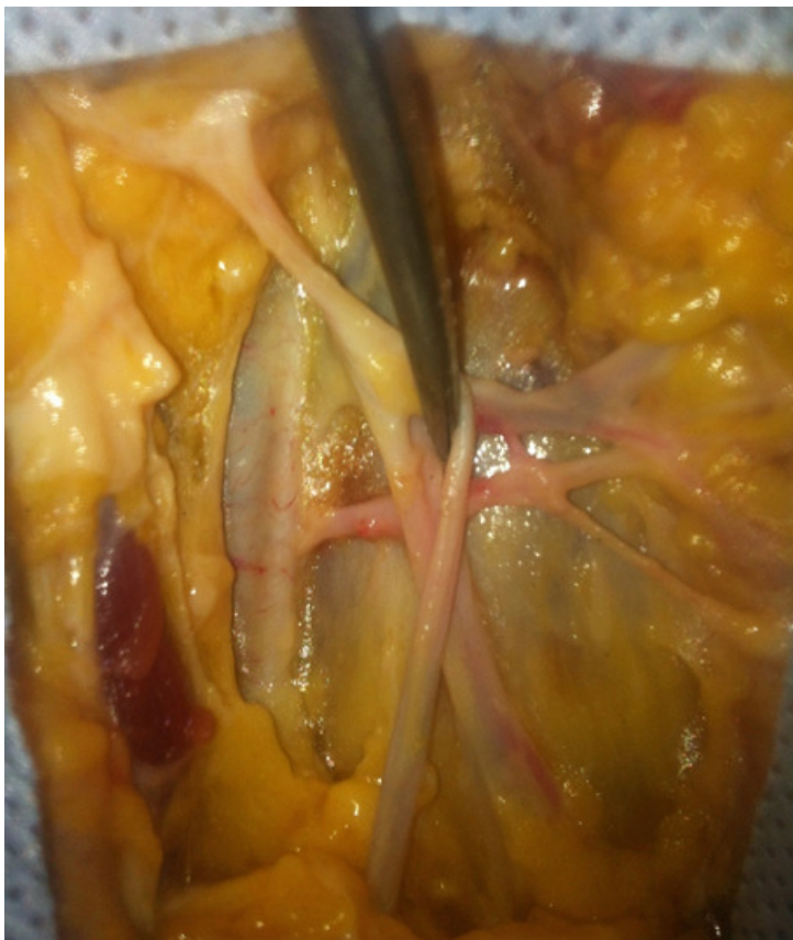
Figure 1: Naissance de l'artère pudendale externe sur l'artère fémorale commune