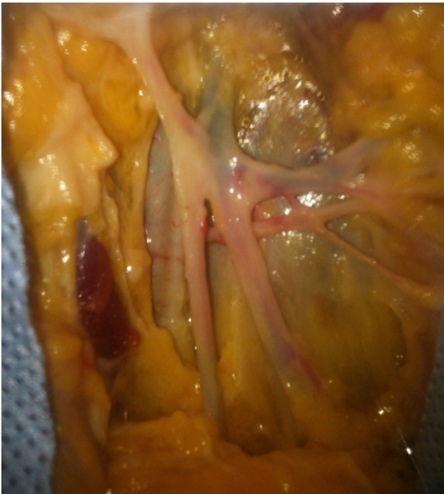
Figure 3: Sous-croisement de la grande veine saphène par l'artère pudendale