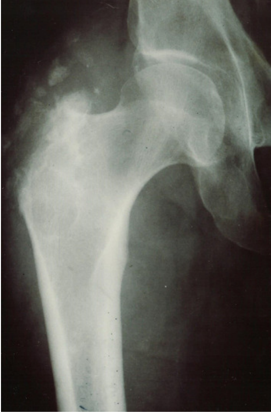
Figure 2: Image radiographique des remaniements du grand trochanter