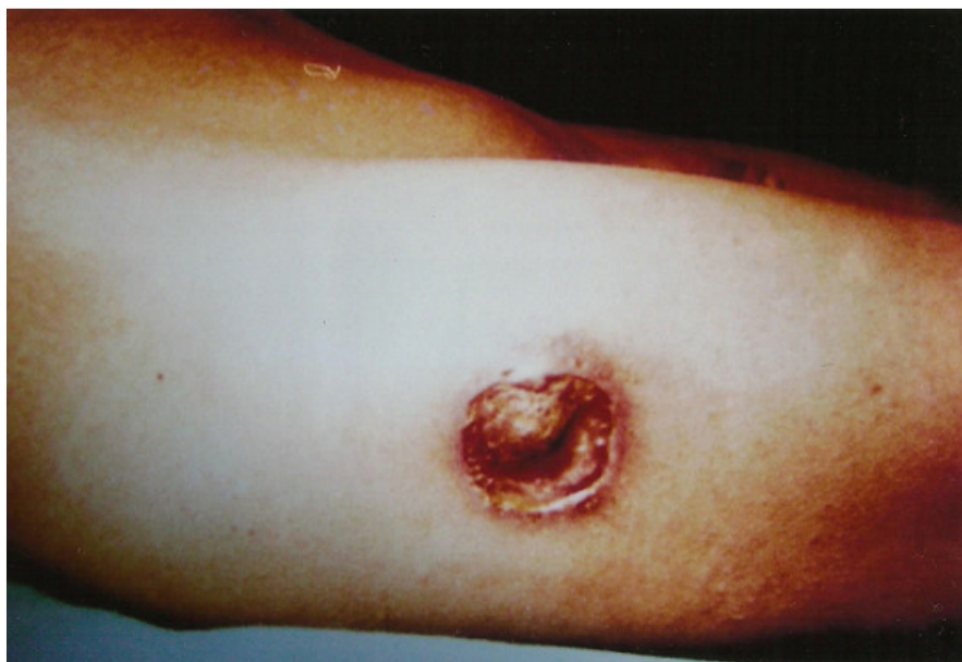
Figure 1: Fistule à la face externe de la cuisse