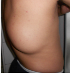
Figure 2: masse tumorale du tiers moyen de la partie droite du dos (vue latérale)