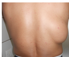
Figure 1: masse tumorale du tiers moyen de la partie droite du dos (vue dorsale)