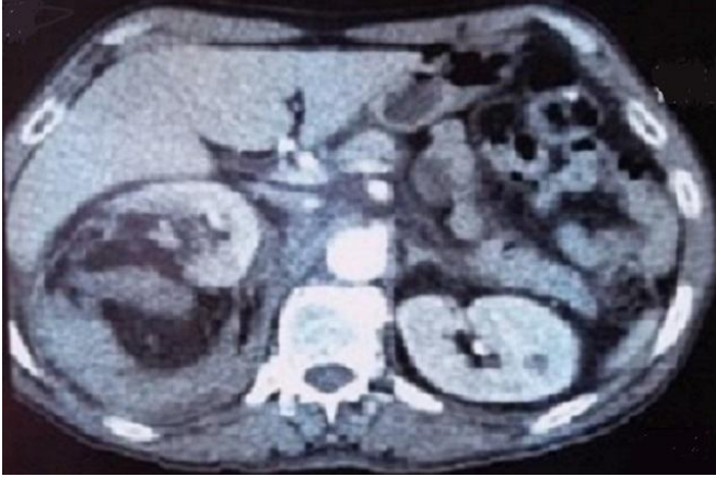
Figure 1: angiomyolipome rénale polaire supérieur droit révélé par un hématome spontanée rétropéritonéale