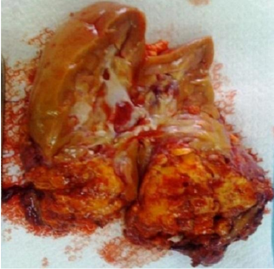
Figure 3: aspect à la coupe après néphrectomie total droite