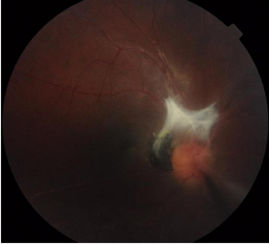
Figure 1: Foyer blanc grisâtre partiellement pigmenté inter papillomaculaire à limites nettes empiétant sur la papille entourée d'un soulèvement rétinien tractionnel avec bride vitréenne dirigée vers la périphérie nasal, macula de siège ectopique

toxocariasis. Retina. 2000;20(1):80-5. PubMed | Google Scholar