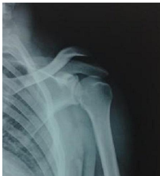
Figure 1: luxation acromio-claviculaire gauche stade V de Rockwood