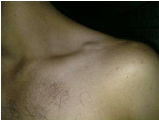
Figure 3: aspect clinique à 24 mois de recul