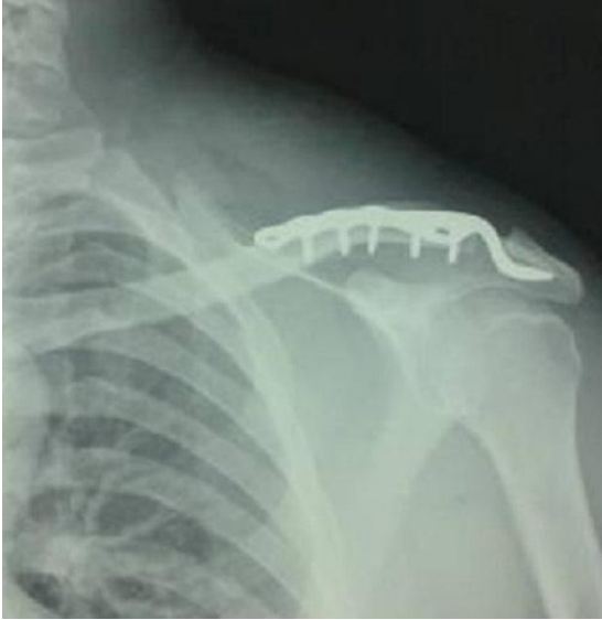
Figure 2: réduction et stabilisation par plaque en crochet