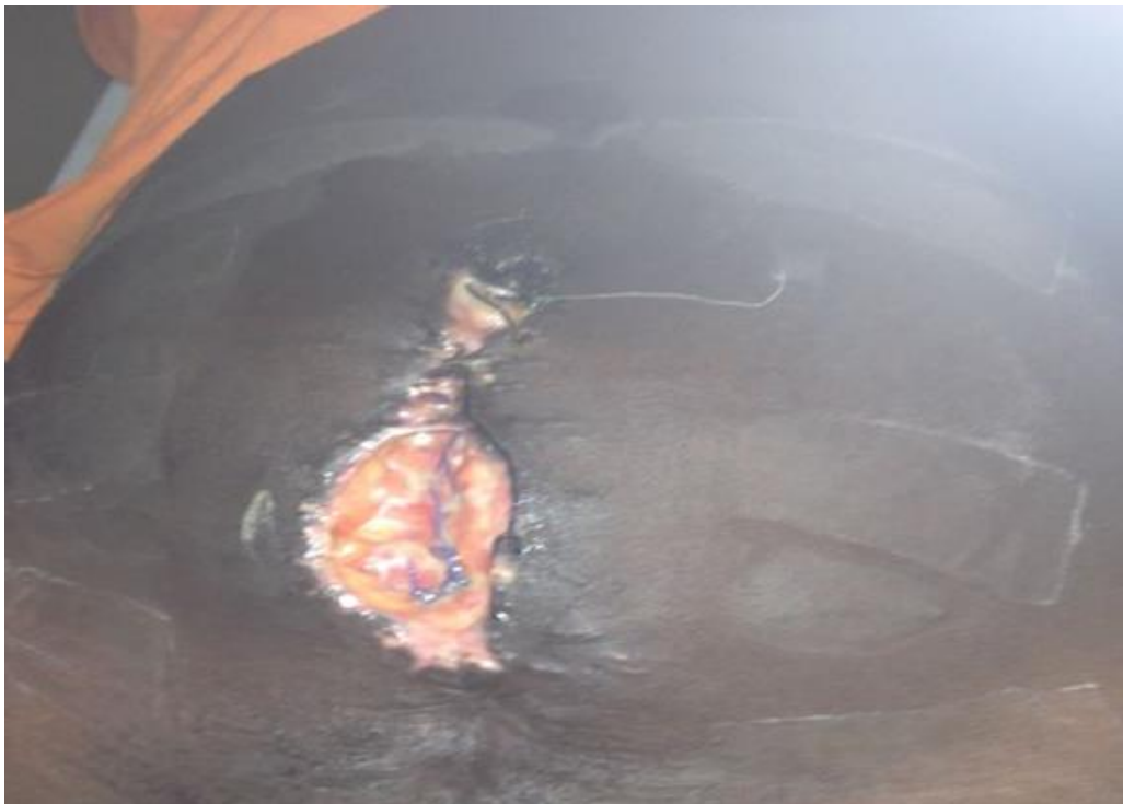
Figure 2: Photo d'un cas d'infection nosocomiale à l'Hôpital général de Référence de Katuba