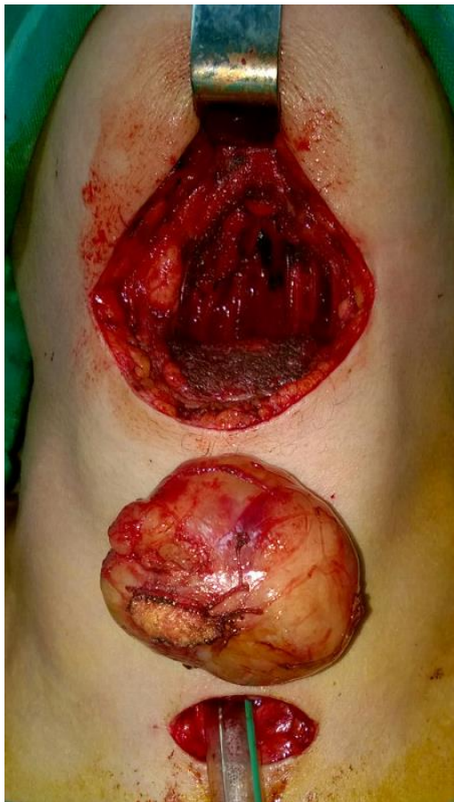
Figure 3: Image de schwannome extra vivo après exérèse par cervicotomie médiane sushyoïdienne avec intubation trachéale