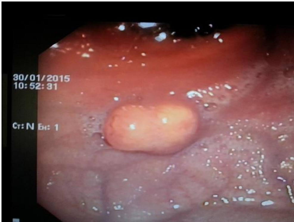
Figure 1: Aspect endoscopique à la fibroscopie œso-gastro-duodénale montrant une lésion bourgeonnante d'allure sous-muqueuse de la grande courbure fundique d'environ 25 mm de diameter