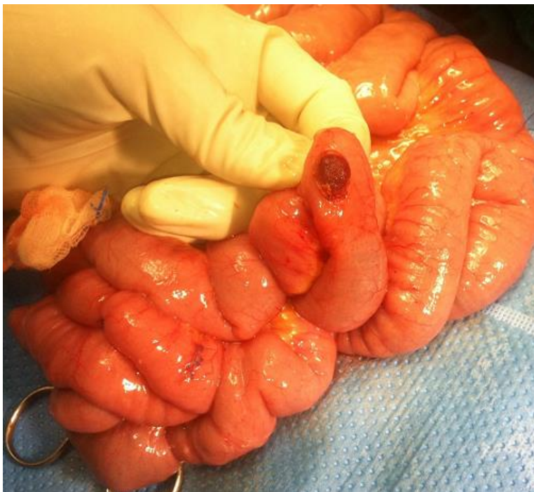
Figure 3: Image en per opératoire du gros angiome au niveau grêle saignant (entérotomie)