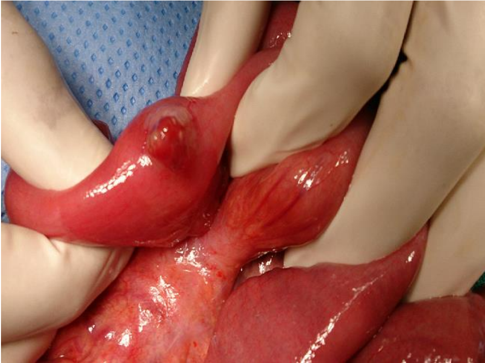
Figure 1: Image en per opératoire montrant un angiome saignant activement au niveau de l'iléon