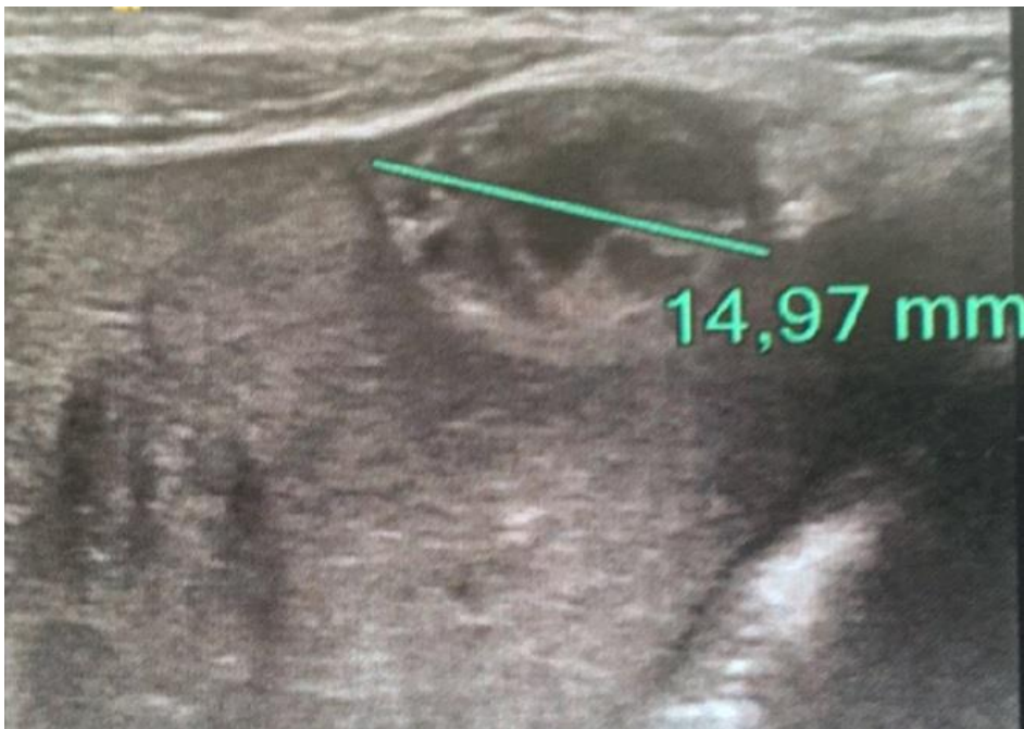
Figure 3: Echographie de contrôle à 1 mois de vie montrant un hématome sous capsulaire en avant du segment V et II hépatiques mesurant 15mm de grand axe