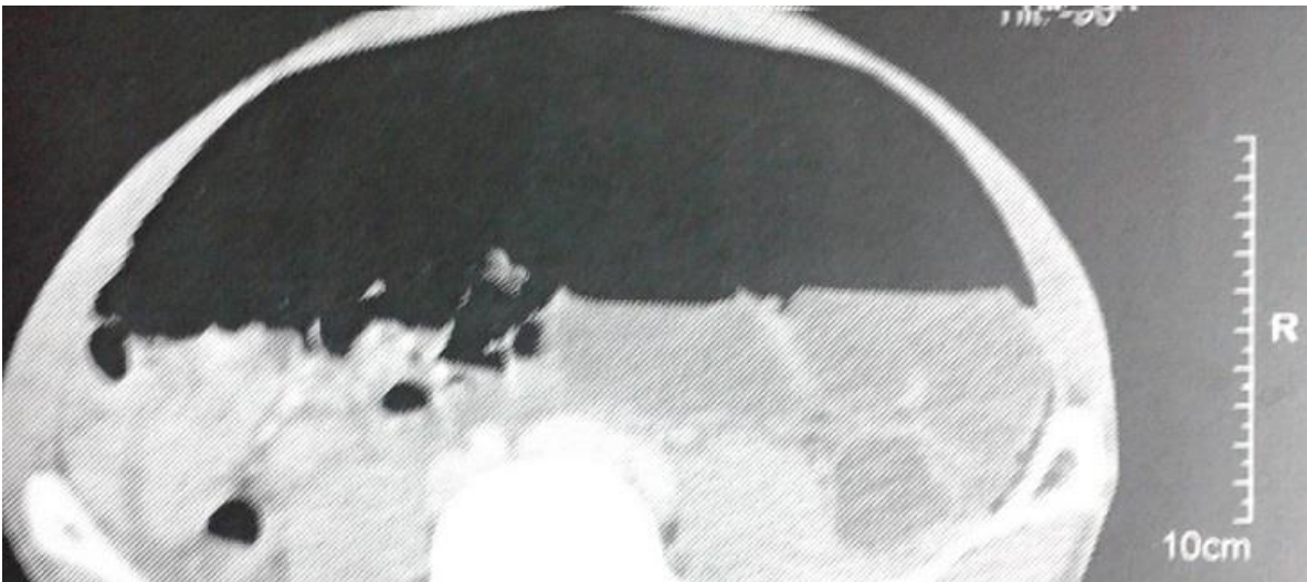
Figure 2: Aspect TDM du pneumopéritoine plaquant les anses contre le péritoine pariétal postérieur