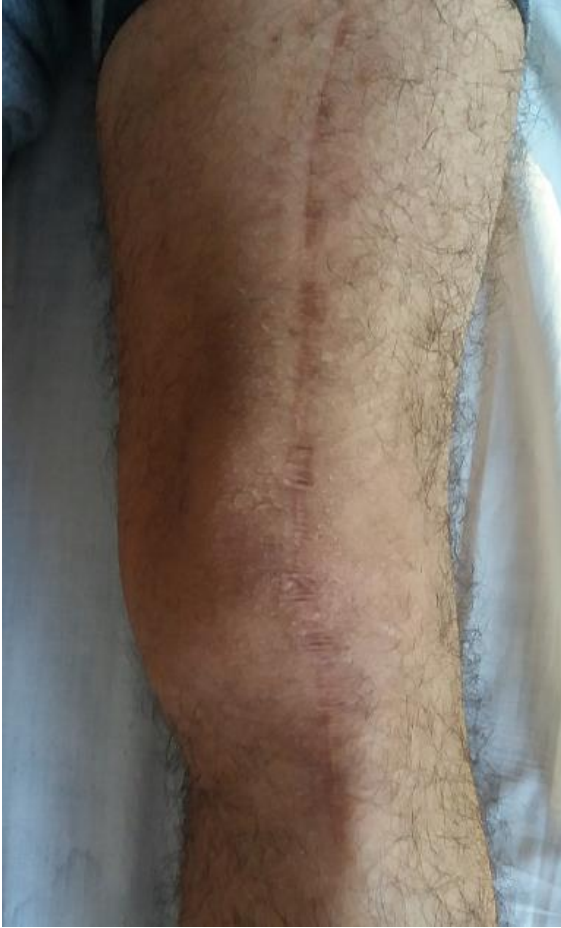
Figure 3: Cicatrice du ligamentoplastie (Lerat) du genou gauche