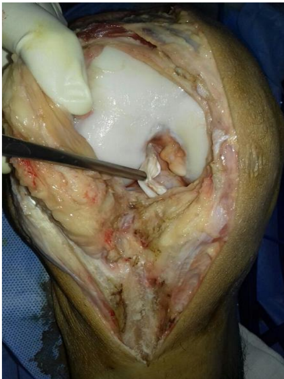
Figure 6: Aspect per-opérateur distendu de notre LCA droit anciennement reconstruit