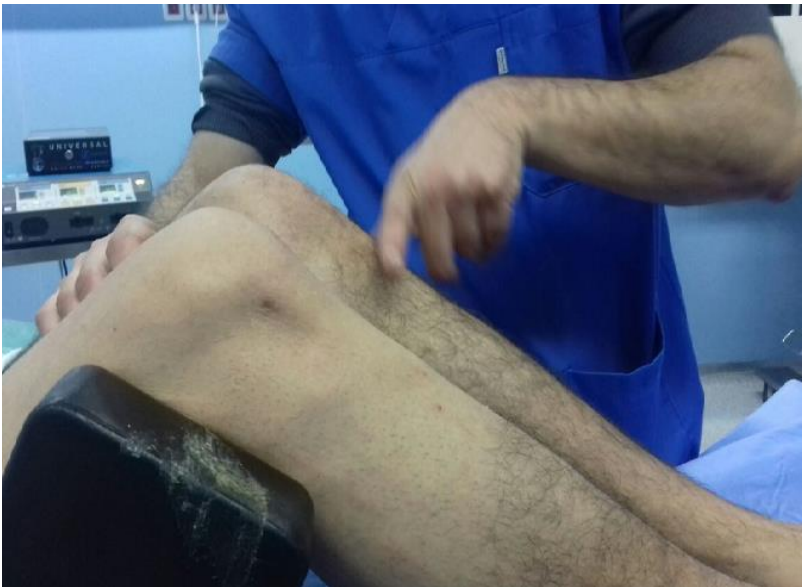
Figure 4: Avalement de la TTA droite