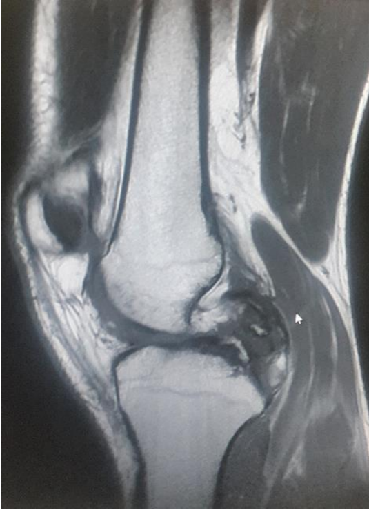
Figure 1: IRM du genou gauche