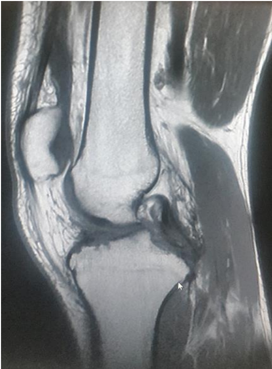
Figure 2: IRM du genou droit