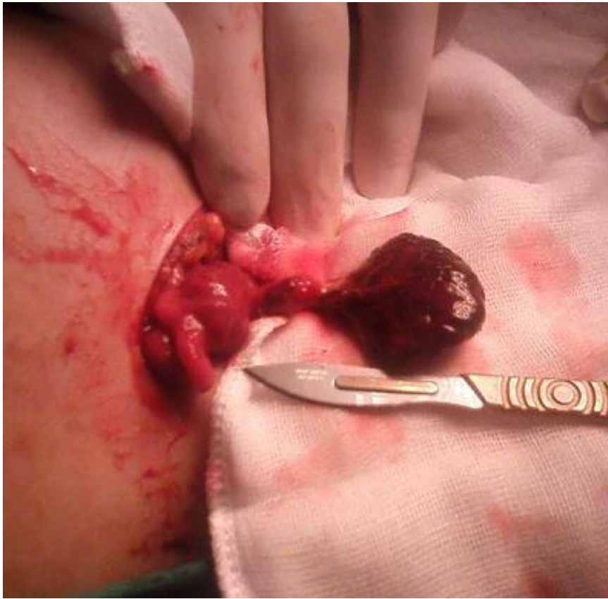
Figure 2: ovaire nécrosé en per opératoire