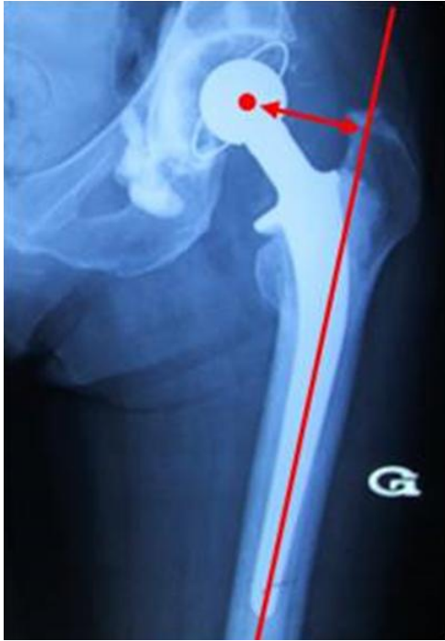
Figure 2: Calcul du déport femoral