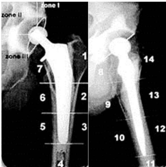
Figure 5: Usure du polyéthylène: en l'absence d'usure, le milieu du segment joignant les deux extrémités de la cupule et le centre de la tête sont superposables ; lorsqu'ils ne le sont plus, la distance entre ces deux points quantifie l'usure