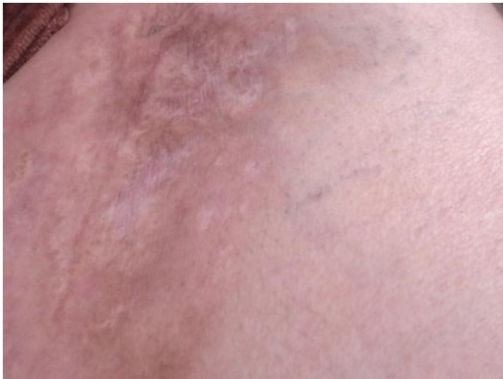
Figure 2: Nodules hyperchromiques de la cuisse