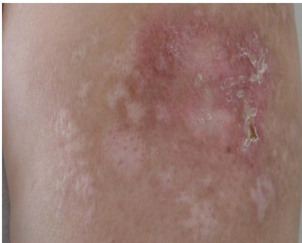
Figure 4: Evolution sous traitement des lésions du bras: disparition des nodules et des desquamations cutanées