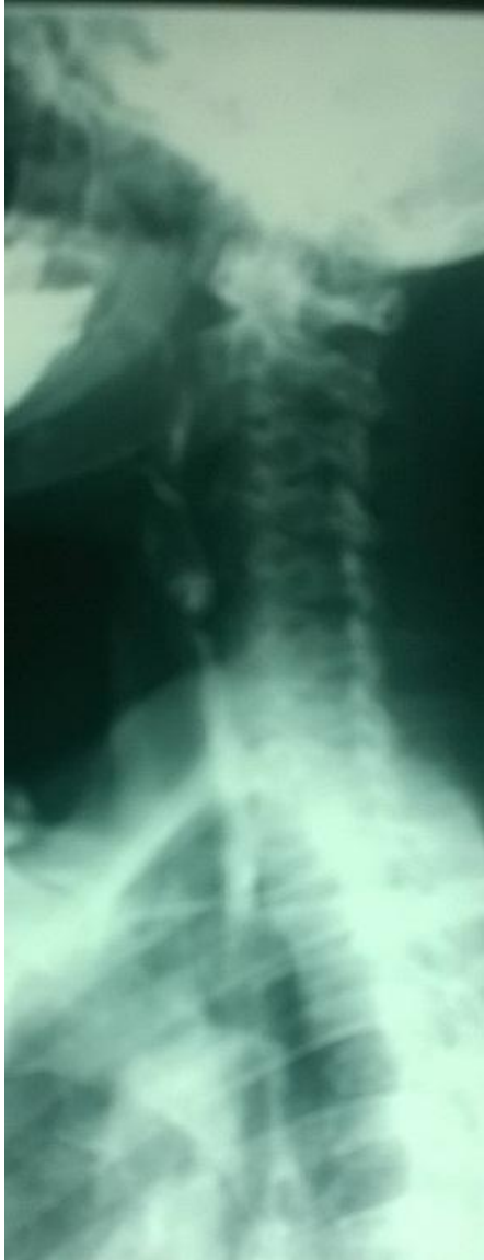
Figure 2: Transit oeso gastro duodenal incidence de profil avec couche mince du produit de contraste montrant une depression de la paroi posterieure de l'oesophage cervical orientant vers une origine extrinseque