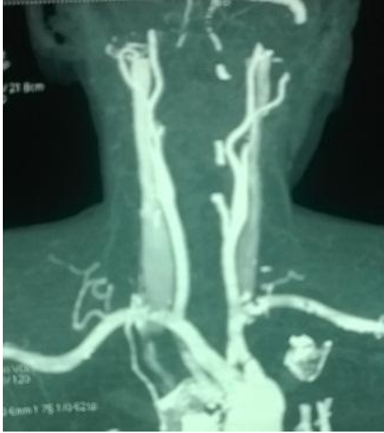
Figure 3: AngioTDM thoracique des troncs supra aortiques montrant une artère sous clavière droite aberrante à l'origine de la compression pariétale de l'œsophage