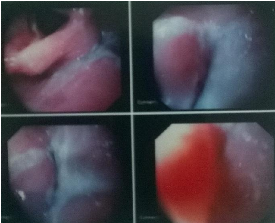
Figure 1: Images de fibroscopie oeso gatro duodenale montrant une lumière infranchissable au niveau de l'œsophage cervical secondaire à une compression probablement d'origine extrinsèque