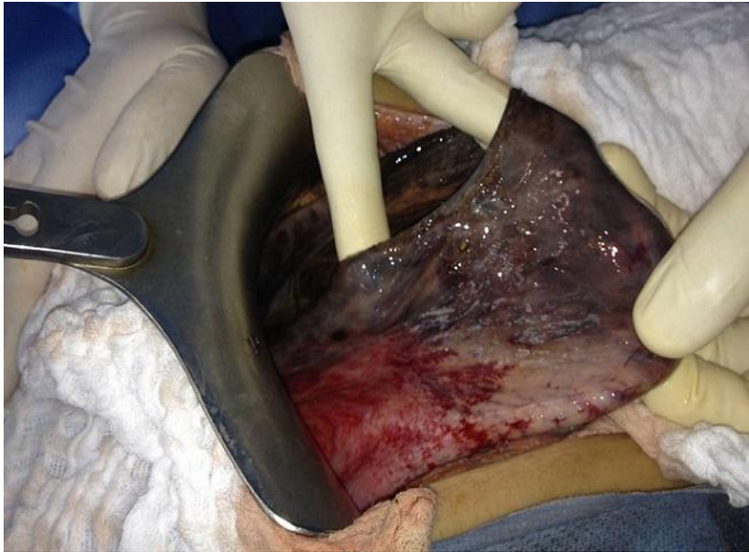
Figure 2: Image pér-opératoire montrant l'étendue de la nécrose gastrique