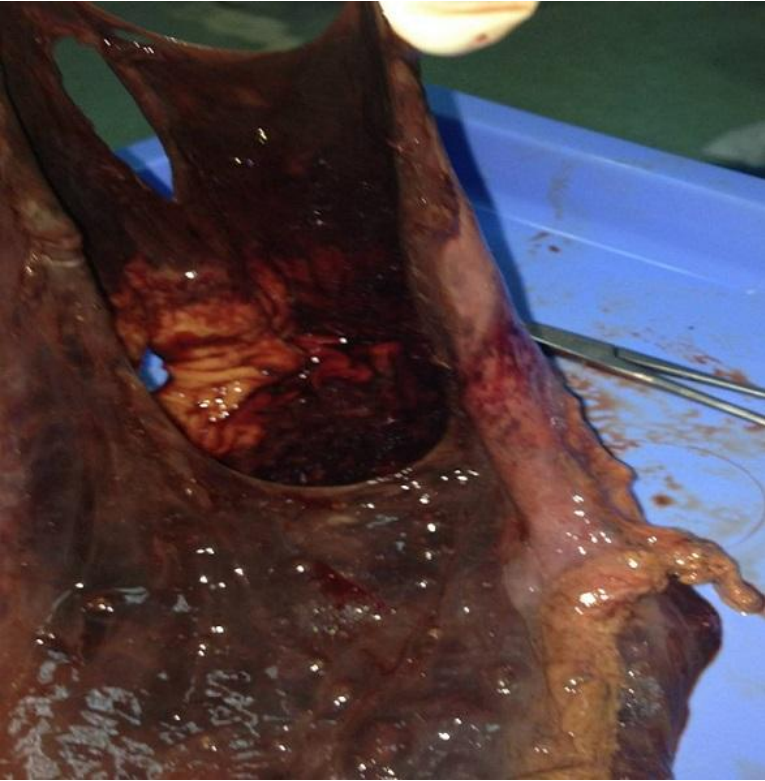
Figure 4: Pièce opératoire, estomac nécrosé en totalité