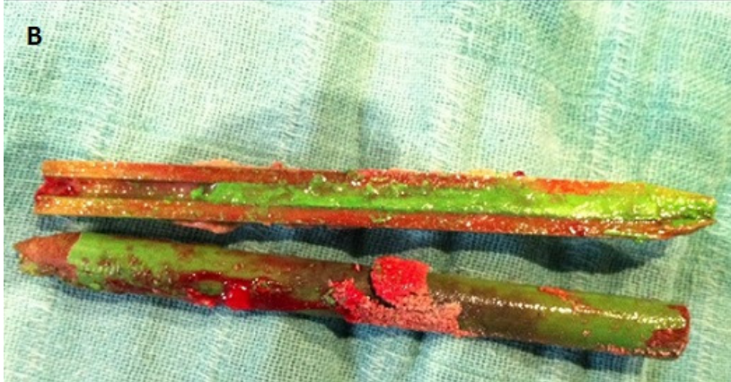
Figure 1 : A) aspect TDM du corps étranger intravesical, hyperdense, éfilé à son extrémité ; B) aspect du corps (crayon) après extraction par cytoscopie