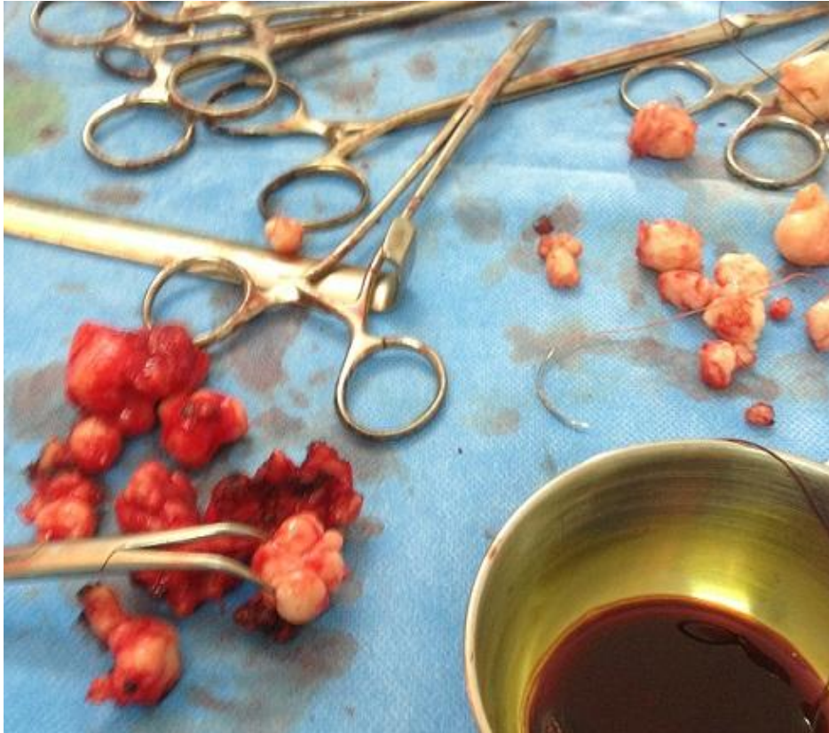
Figure 2: Noyaux utérins (en haut) sigmoïdiens et pariétaux (en bas)