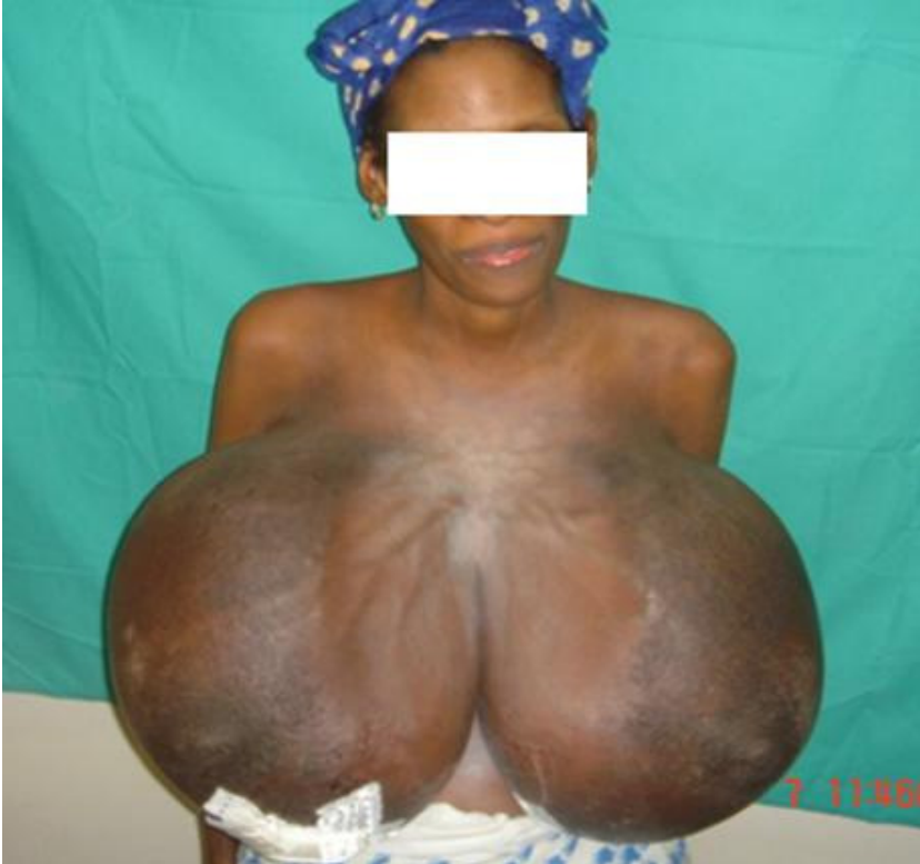
Figure 1: Volumineuse hypertrophie mammaire bilatérale et éléphantiasiforme