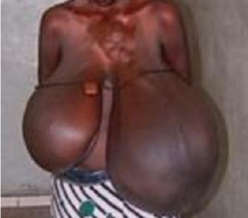
Figure 3: Volumineuse hypertrophie mammaire bilatérale et éléphantiasiforme