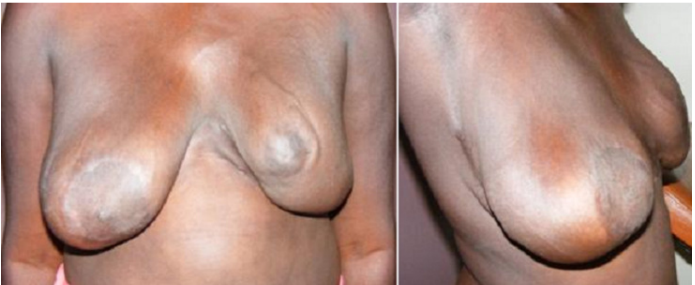
Figure 4: Réduction mammaire pour gigantomastie gravidique. Vues de face et de profil à 12 mois