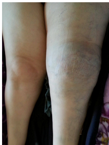
Figure 1: Image clinique du membre inférieur gauche montrant une hypertrophie musculaire de la cuisse gauche avec de nombreuses varicosités diffuses

Figure 2: Radiographie standard de la cuisse gauche montrant un fémur dysplasique déformé et aminci siège d'une fracture pathologique à son tiers supérieur peu déplacée