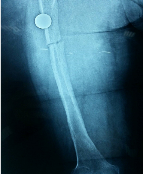
Figure 2: Radiographie standard de la cuisse gauche montrant un fémur dysplasique déformé et aminci siège d'une fracture pathologique à son tiers supérieur peu déplacée