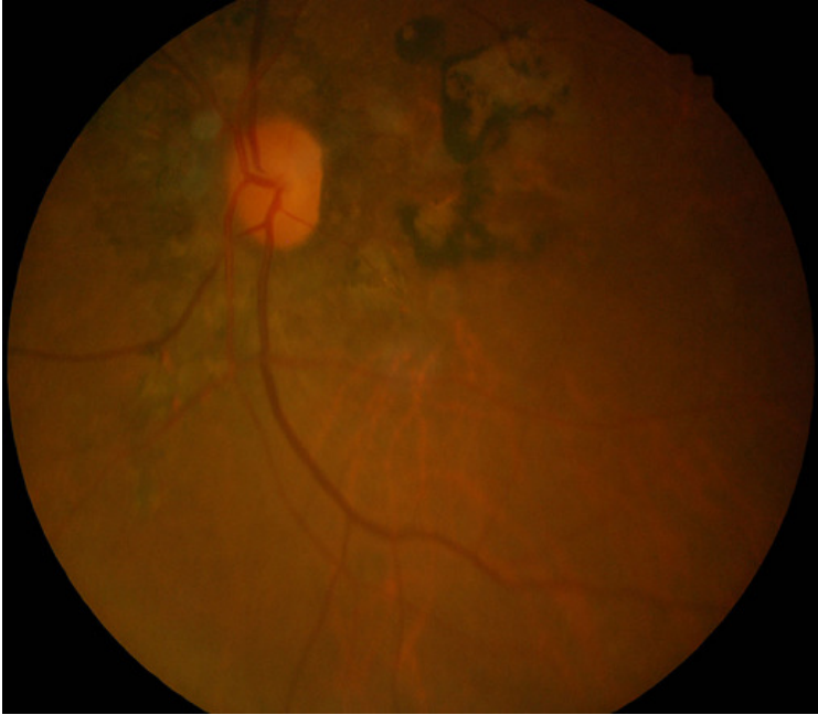
Figure 2: Cicatrice chorio-rétinienne maculaire œil gauche