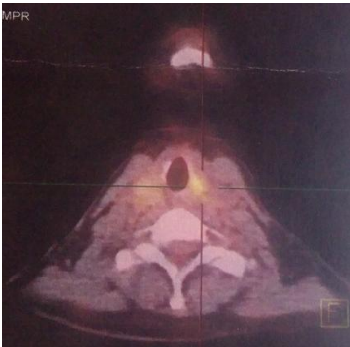
Figure 2: Foyer hyper métabolique de la loge thyroïdienne postérieur gauche (SUV max 3,59) compatible avec une récive ou une maladie néoplasique résiduelle