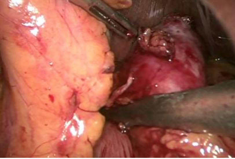
Figure 2: Exérèse chirurgicale réalisée à l'aide de trois applications d'une pince Endo-GIA