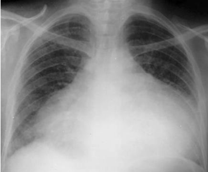
Figure 1: Radiographie du thorax face chez la patiente numéro 1: aspect de cardiomégalie