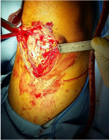
Figure 4: Rupture des muscles droit fémoral et vaste interne après abord chirurgical