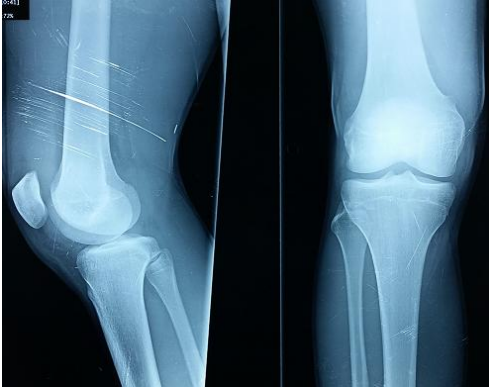
Figure 2: Aspect radiologique