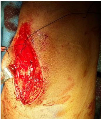
Figure 5: Réparation chirurgicale