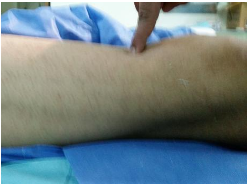
Figure 1: Aspect clinique avec dépression objectivée à la pression