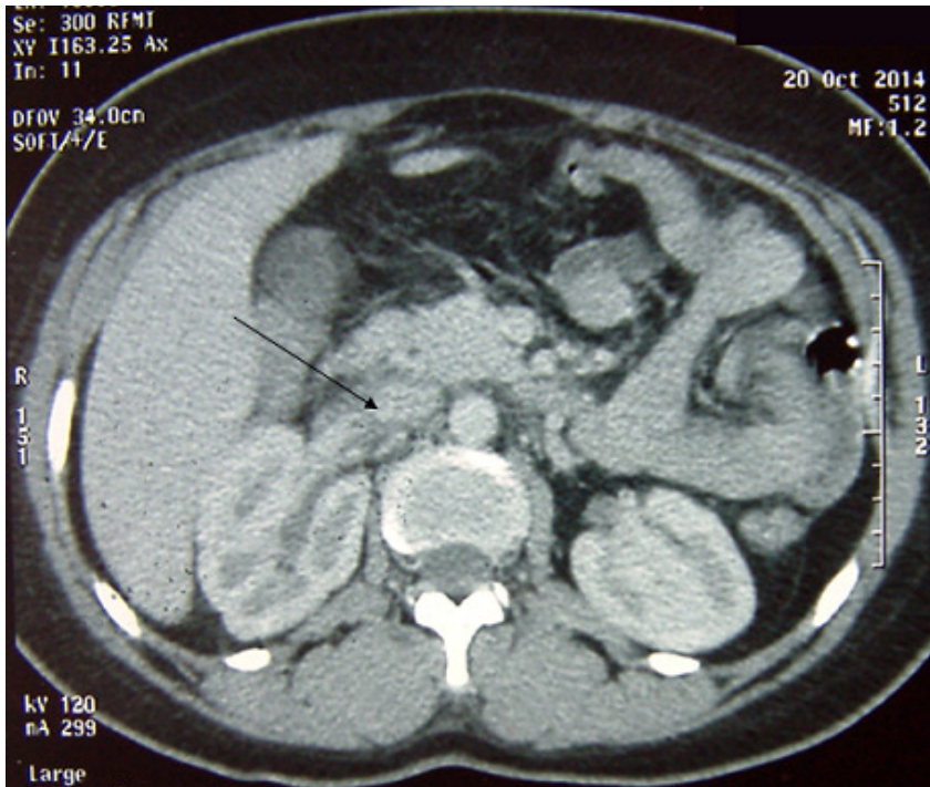
Figure 1: scanner abdominal, coupe axiale, avec injection du PC, thrombose de la veine ovarienne droite envahissant la veine cave inferieur