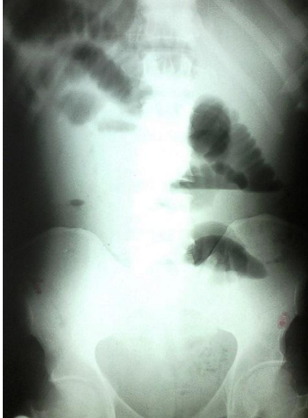
Figure 1: Radiographie de l'abdomen sans préparation montrant des images en faveur d'une occlusion intestinale