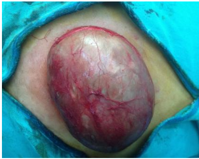
Figure 3: Vue opératoire montrant un kyste dermoïde géant de la paroi abdominal