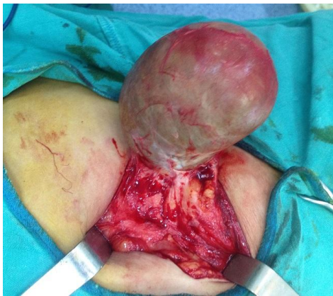
Figure 4: Exérèse complète de kyste dermoïde géant de la proi abdominale