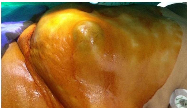
Figure 1: Vue externe: masse de la paroi abdominale anterolatérale gauche

6. Boylson AW, Sim AJ. Dermoid cyst of the rectum. Dis Colon Rectum . 1983 May;26(5):333-4. PubMed | Google Scholar