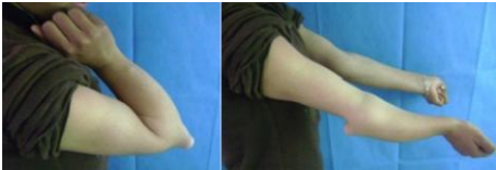
Figure 1: Déformation de l'avant bras et le déficit de mobilité en préopératoire