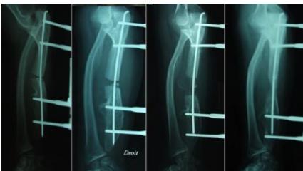
Figure 3: Progression de l'allongement de l'ulna et persistance de la luxation de tête radiale