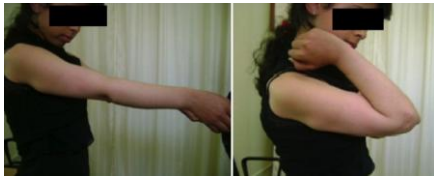
Figure 5: Correction de la déformation de l'avant-bras, amélioration de la mobilité et disparition de la tuméfaction du coude en post-opératoire