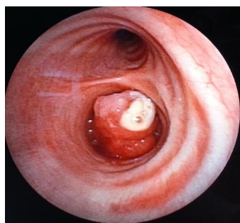
Figure 2: tumeur à couleur rougeâtre, recouverte de nécrose et obstruant totalement l'entrée de la bronche souche droite