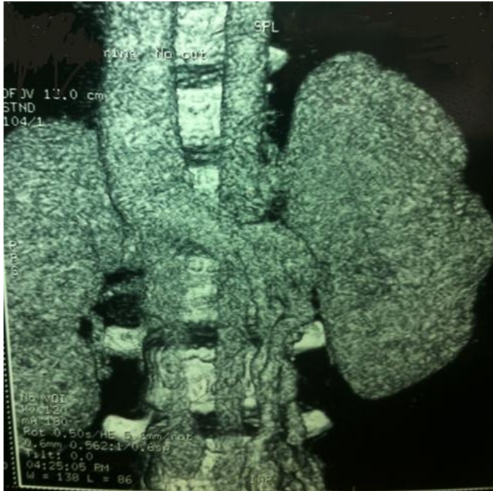
Figure 2: Angioscanner montrant une absence de la VCI sous-rénale