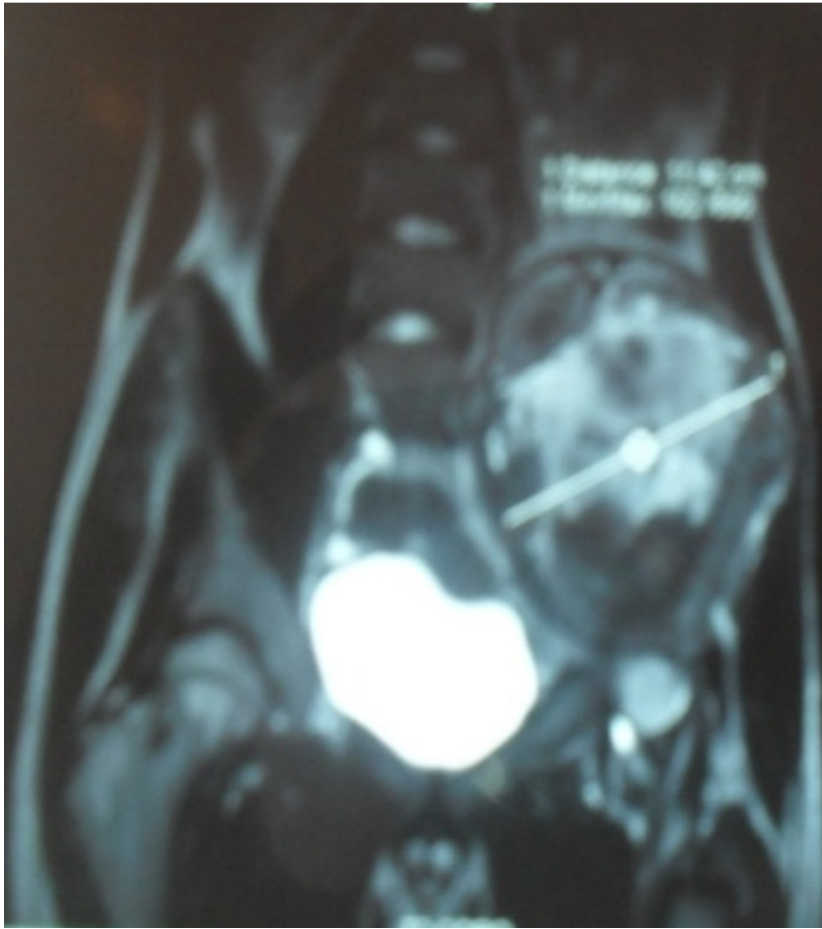
Figure 2: coupes coronales de la même masse comprimant le nerf fémoral