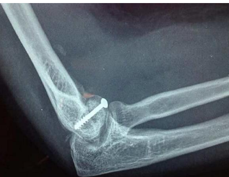
Figure 6: contrôle radiographique de profil du montage