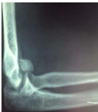
Figure 1: radiographie du coude droit de profil montrant le cal vicieux du capitellum