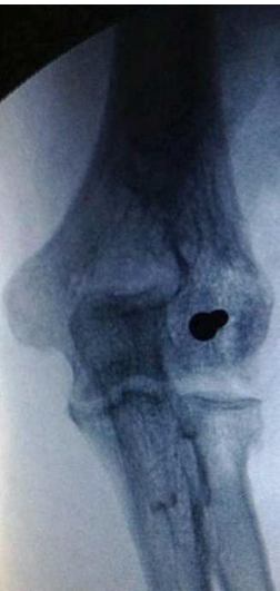
Figure 5: contrôle radiographique de face du montage