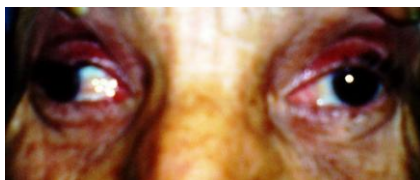
Figure 2: paralysie du regard en dedans de l'œil gauche