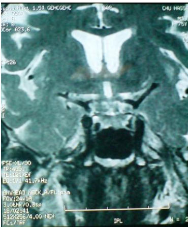
Figure 5: coupe frontale à l'IRM cérébrale en séquence T2 ne montrant pas d'anomalies au niveau du sinus caverneux