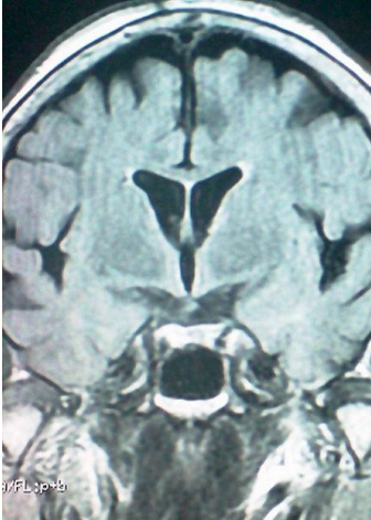
Figure 4: coupe frontale à l'IRM cérébrale en séquence T1 ne montrant pas d'anomalies au niveau du sinus caverneux