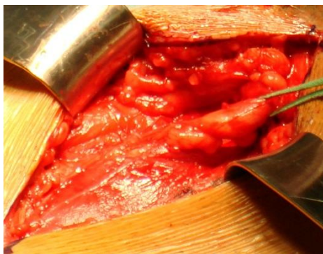
Figure 2: dissection du cordon spermatique