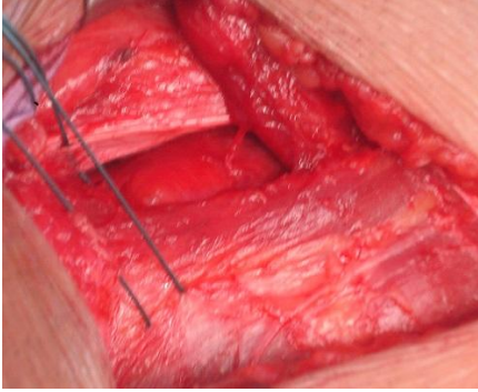
Figure 3: myofascioplastie profonde (a)