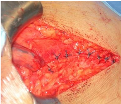
Figure 5: fascioplastie superficielle