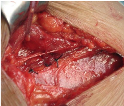
Figure 4: myofascioplastie profonde (b)