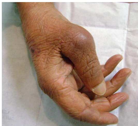
Figure 1: tuméfaction inflammatoire avec déformation du pouce