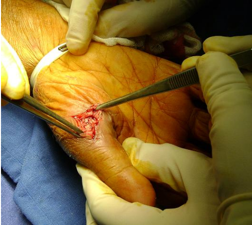
Figure 3: biopsie chirurgicale directe de la lésion et réduction de la luxation