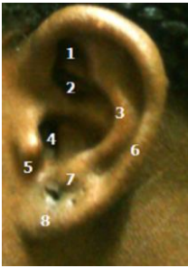
Figure 1: anatomie de l'oreille normale