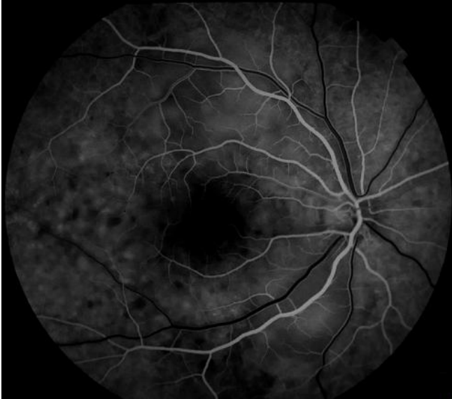
Figure 1: temps précoces montrant un retard de remplissage choroidien avec de multiples points hyperfluorescents en tête d'épingle (pin-points)