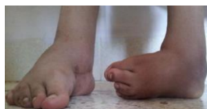
Figure 1: fille de 11 ans, ayant un Pied bot varus équin bilatérale opérée à droite avec bon résultat et revient pour le pied gauche

Figure 4: aspect final avec deux pieds plantigrades