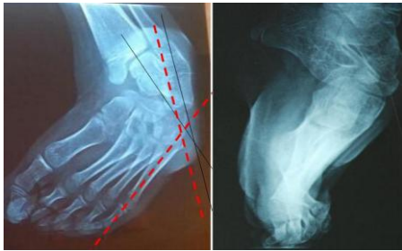
Figure 2: aspect radiologique du pied gauche