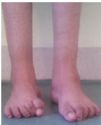
Figure 4: aspect final avec deux pieds plantigrades