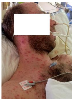
Figure 1: éruption érythémato-vésiculeuse prurigineuse au niveau du thorax et la face