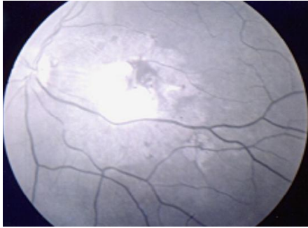
Figure 1: Cliché anérythre de l'œil gauche montrant le tuberculome maculaire