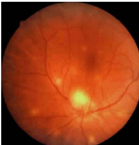
Figure 3: Cliché anérythre de l'œil montrant des nodules blanchâtres sous rétiniens disséminés: tubercules choroïdiens de Bouchut