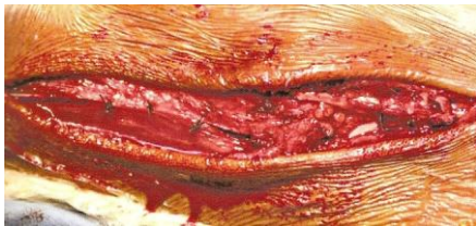
Figure 7: Fermeture de la gaine des fibulaires