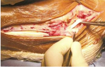
Figure 1: Incision cutanée et repérage du court fibulaire