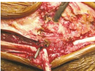
Figure 4: Tunnel malléolaire lateral