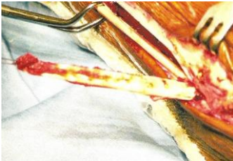
Figure 3: Transplant du court fibulaire