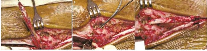
Figure 5: A, B, C: Progression du transplant dans le tunnel malléolaire