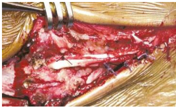
Figure 6: Suture du transplant sur lui-même