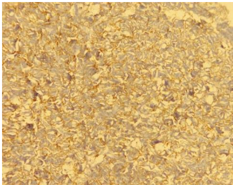
Figure 4: Immunomarquage positif au DOG1 des cellules tumorales mésentériques (grossissement X10)