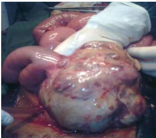
Figure 1: Aspect macroscopique de la tumeur iléale