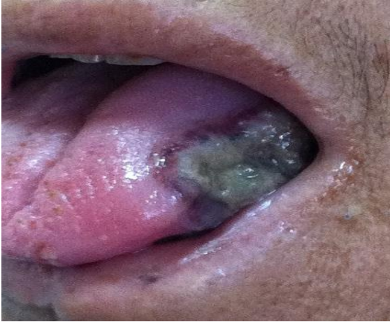
Figure 1: ulcération nécrotique du bord latéral de la langue