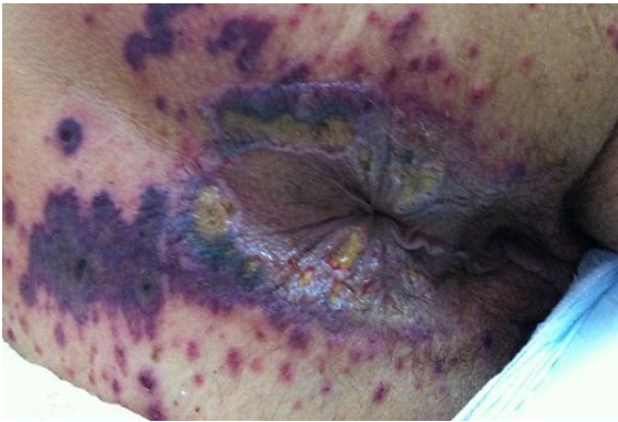
Figure 2: ulcérations péri-anales avec des lésions purpuriques infiltrées et nécrotiques