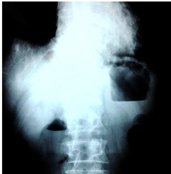
Figure 1: Radiographie de l'abdomen : notez la superposition des deux niveaux hydro- aériques, le grand traduisant la stase gastrique, le plus petit l'obstruction duodénale

Figure 3: Vue opératoire, distension duodénale en amont de la compression par l'artère mésentérique supérieure